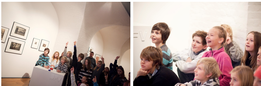
Fra Fotoquizen.

Quizboksene har lys og lyd, sørger for litt temperatur på slutten av besøket, og vi kommer inn i det magiske rommet der læring og underholdning smelter sammen. I tillegg får elevene bruk for kunnskapene de akkurat har tillært seg i løpet av omvisningen, og de viser forbausende god evne til å memorere og gjenfortelle det som har blitt sagt!