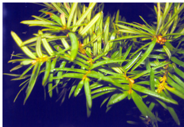
Elevoppgave: "Noe spisst"