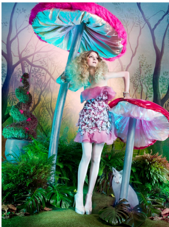
fra serien Alice in Wonderland

Vi bruker utstillingen til å finne vinklinger og tema som kan være interessante for elevene. Gjennom dialogbasert omvisning søker vi å åpne for forståelse for bildene i utstillingen, samtidig som elevene får bidra med egne synspunkter og egen forståelse.