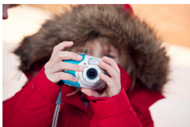
Fotografering med museets kameraer.

Elevene skal løse en tilsynelatende enkel oppgave som kan løses på mange måter avhengig av hvilket nivå elevene befinner seg på. Vi opplever at dette er noe alle mestrer, og likevel har mulighet til å finne utfordrende! De går sammen to og to, og deler på et av museets robuste digitalkameraer. De bruker den tilmålte tiden (ca 30 minutter) på å løse oppgaven. De kan ta så mange bilder de vil, men må til slutt velge ett bilde hver som skrives ut. Bildene henges opp på veggen. Vi diskuterer bildene underveis eller avslutningsvis. Elevene må samarbeide, de må bruke blikket sitt bevisst, de må bruke egne ord for å argumentere for bildet sitt. Denne oppgaven tilpasses utstillingen de skal se.