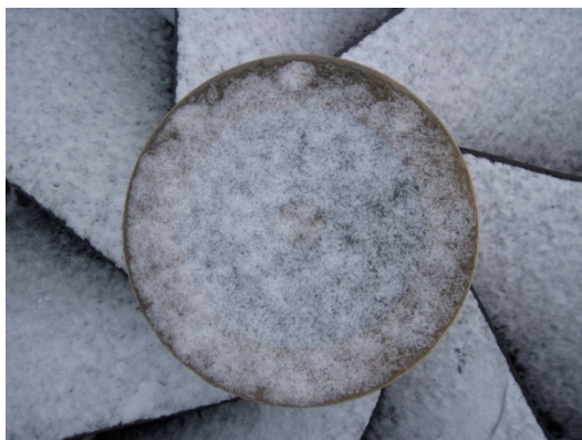
"Noe rundt" – elevarbeid 6. klasse