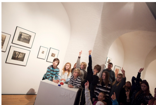
Fra Fotoquizen.

Quizboksene har lys og lyd, sørger for litt temperatur på slutten av besøket, og vi kommer inn i det magiske rommet der læring og underholdning smelter sammen. I tillegg får elevene bruk for kunnskapene de akkurat har tillært seg i løpet av omvisningen, og de viser forbausende god evne til å memorere og gjenfortelle det som har blitt sagt!