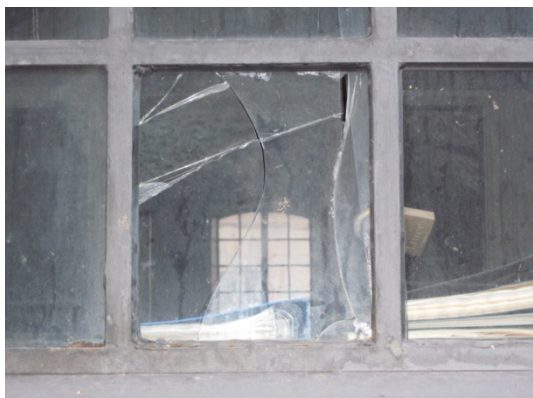
"Noe firkantet" – elevarbeid 6. klasse

Les mer om oppgavene på formidlingssidene på www.preusmuseum.no